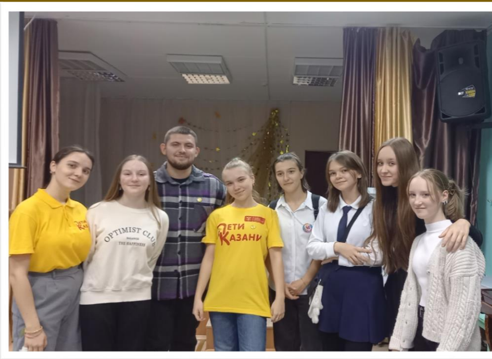
Нетворкинг с Дети Казани