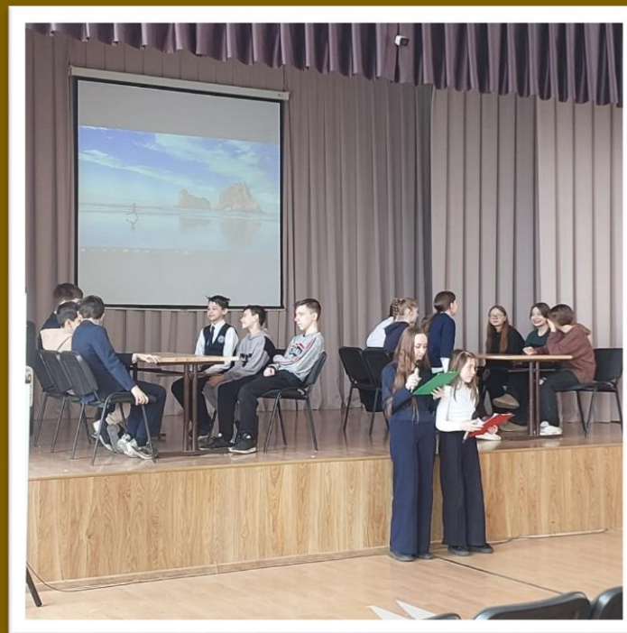
Шоу игра для среднего звена