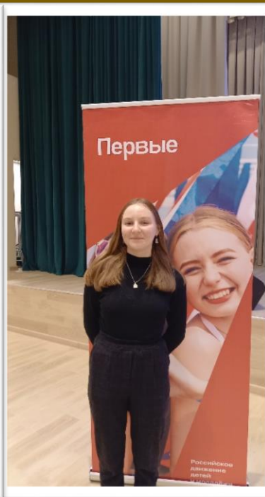
Посвящение в первые