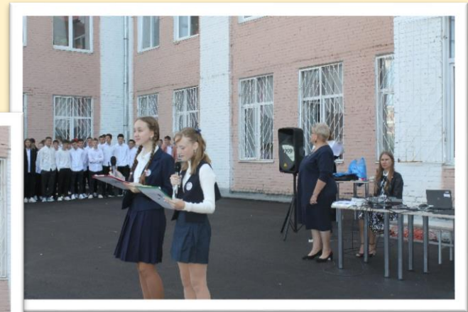
Праздник День знаний