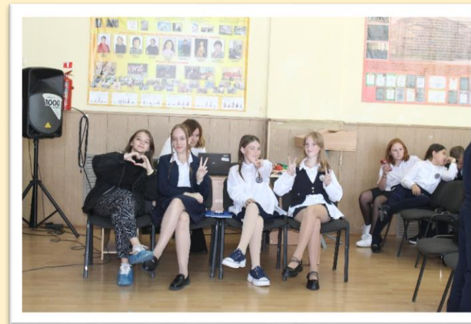
Большой сбор ШУС