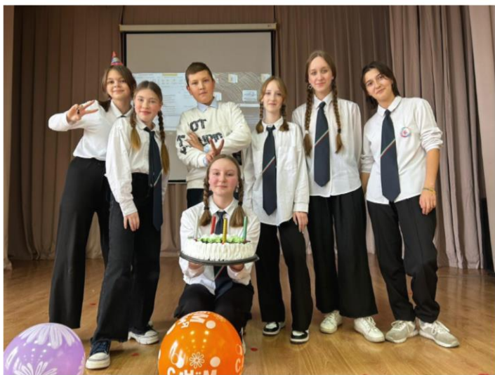
День рождения ШУС СМС